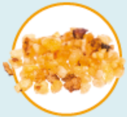
BOSVELIJŲ aliejus ( Boswellia carteri )