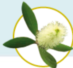
MIRTENIŲ aliejus ( Melaleuca leucadendron Cajaputī )

Eterinių aliejų mišinys 100 % GRYNAS NATŪRALUS AKTYVUS