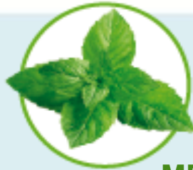
MĖTŲ aliejus ( Mentha arvensis )