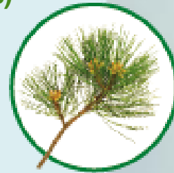
PUŠŲ aliejus ( Pinus sylvestris )